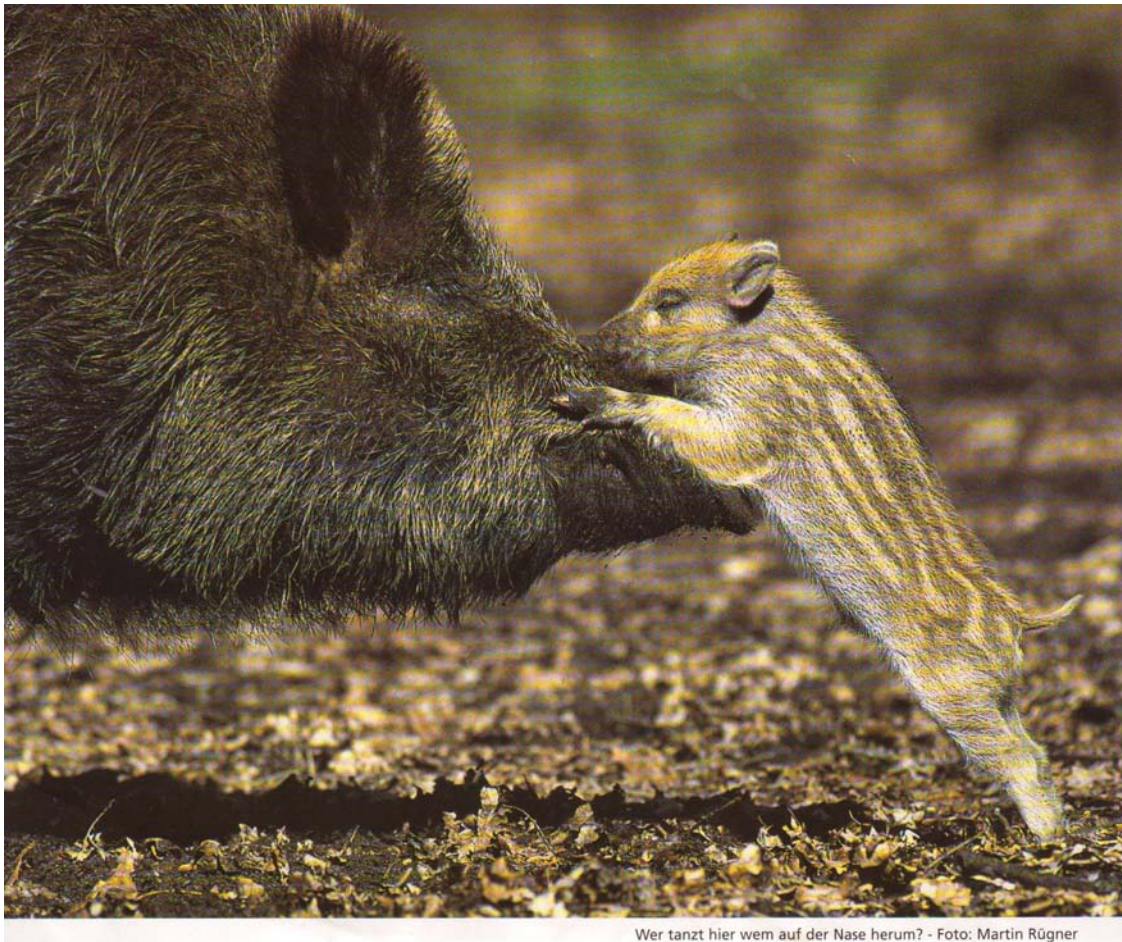
Wer tanzt hier wem auf der Nase herum?

Liebe Mitglieder und Teckelfreunde, und wieder beginnt ein neues Jahr mit unseren Teckeln!! Wir hoffen, Sie hatten eine schöne Weihnachtszeit und wünschen nun ein gutes, gesundes neues Jahr für Sie alle!